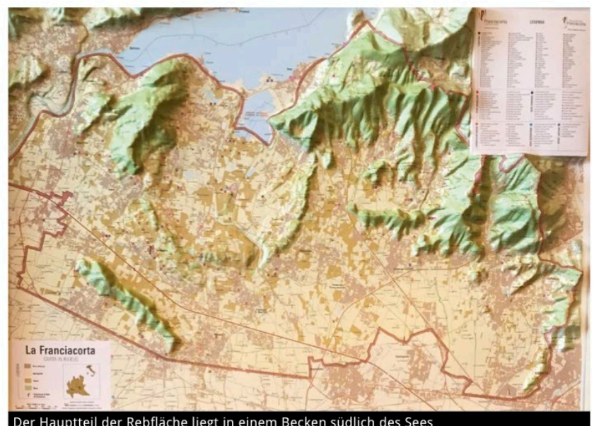
Der Hauptteil der Rebfläche liegt in einem Becken südlich des Sees