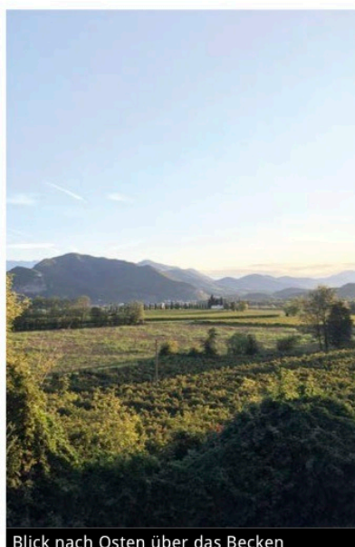
Blick nach Osten über das Becken

Rebfläche: 2.800 ha Rebsorten: 82% Chardonnay, 14% Pinot Nero, 4% Pinot Bianco Produktion 2016: 17 Mill. Flaschen Export 2016: 1,74 Mill. Flaschen Mindestreifezeit (von Tirage bis Dégorgement): Franciacorta 18 Monate Franciacorta Rosé 24 Monate Franciacorta Satèn* 24 Monate Franciacorta Vintage 30 Monate Franciacorta Riserva 60 Monate *Satèn nur aus weißen Trauben, max. 5 Bar Druck, max. 50% Pinot Bianco